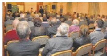
Der Saal war vollends ausgefüllt

lerdings müsse man sofort handeln. Vorschläge zur Gesundung: unter anderem müsse Geld effizienter eingesetzt werden, vom Bund über die Länder bis zu den Gemeinden, so Moser. Mehr auf tips.at/zwettl ■