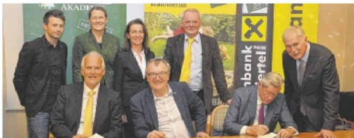
Josef Moser (sitzend, 1.v.l.) und Hannes Androsch (sitzend, 3.v.l.) diskutierten in Zwettl

ZWETTL. Die Waldviertel Akademie lud zur Diskussion mit dem früheren SPÖ-Vizekanzler Hannes Androsch und den ehemaligen Rechnungshofpräsidenten Josef Moser. Die beiden präsentierten ihr „Büchlein“: „Einspruch: Der Zustand der Republik und wie sie noch zu retten ist“.